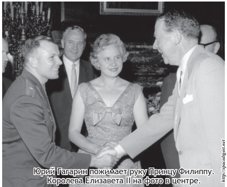
Юрий Гагарин пожимает руку Принцу Филиппу Королевы Елизавета II на фото в центре.