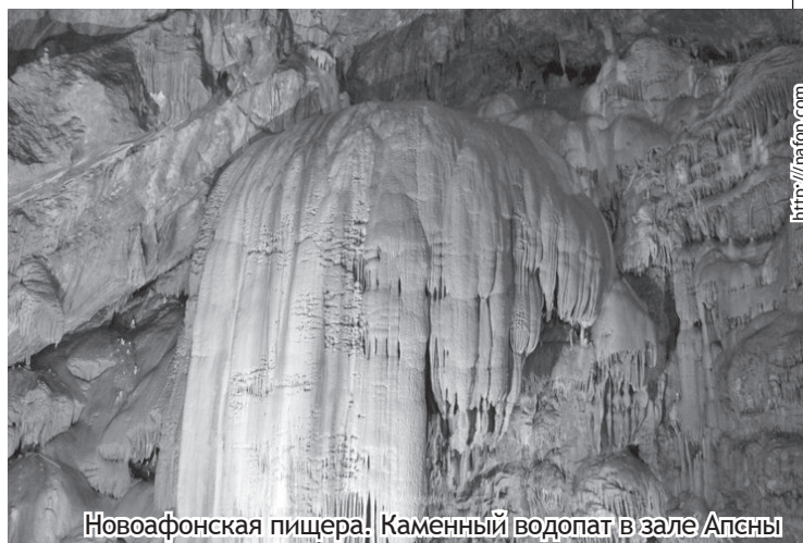
Новоафонская пещера. Каменный водопад в зале Апсны